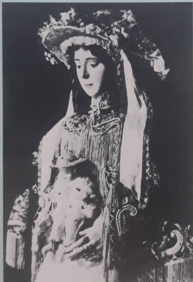
FOTO-RECUERDO DE LA PRIMERA FUNCIÓN SOLEMNE CELEBRADA CON MOTIVO DE LA BENDICIÓN DEL SIMPECADO Y TRIDUO A NTRA. SRA. DEL ROCÍO (9 DE MAYO DE 1976).