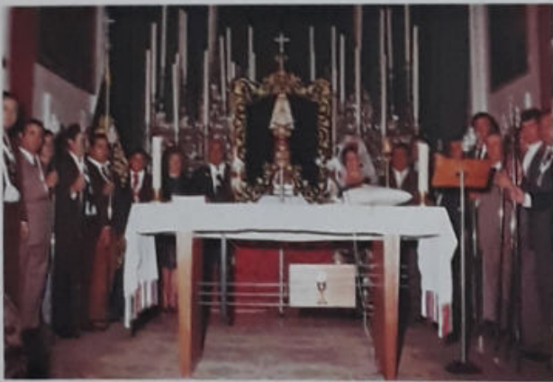
BENDICIÓN DEL SIMPECADO. MAYO 1976.