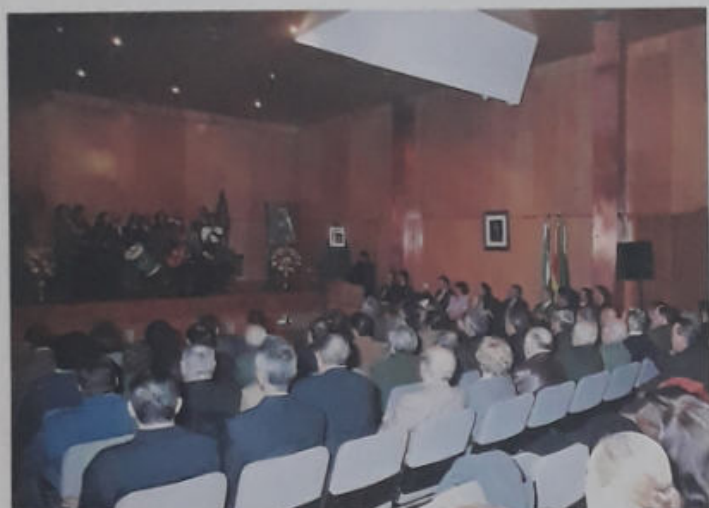
ACTUACIÓN DEL CORO DE LA HERMANDAD