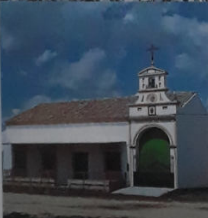
CASA HERMANDAD EN EL ROCÍO.