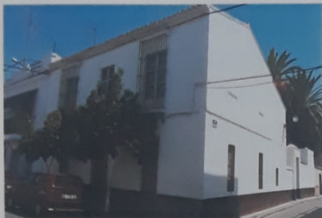
CASA HERMANDAD DE CAMAS