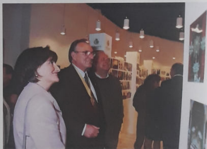
INAUGURACIÓN DE LA EXPOSICIÓN FOTOGRÁFICA