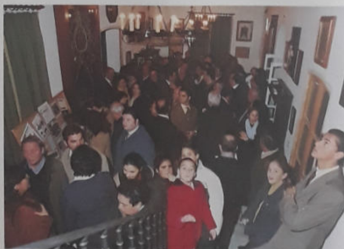
NUMEROSA ASISTENCIA DE HERMANOS E INVITADOS EN LA CASA DE HERMANDAD