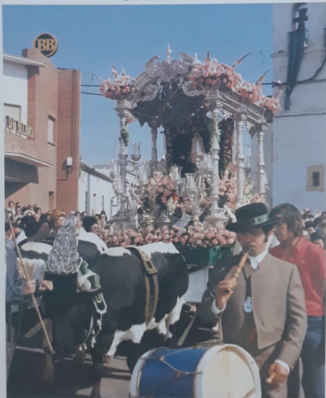
PRIMERA SALIDA DE LA CARRETA DEL SIMPECADO (1977)