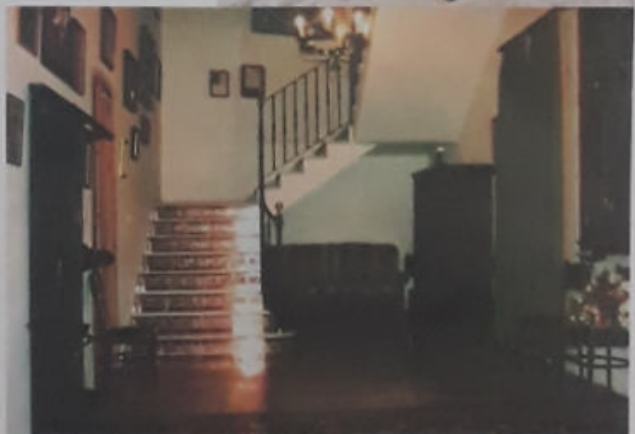
ASPECTO ACTUAL DEL SALÓN DE LA CASA HERMANDAD DE CAMAS