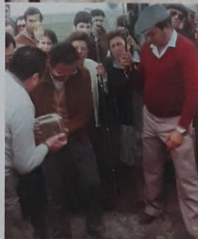
PRIMERA PIEDRA DE LA CASA HERMANDAD DEL ROCÍO. 19 MARZO 1988.