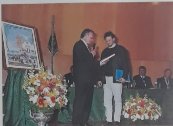
PRESENTACIÓN DEL CARTEL CONMEMORATIVO