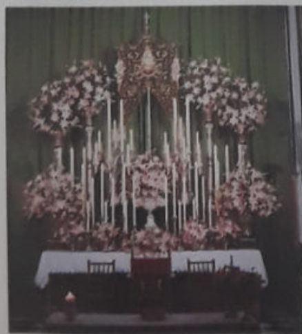
ALTAR DE CULTOS EN LA CELEBRACIÓN DEL 25 ANIVERSARIO DEL SIMPECADO (2001)