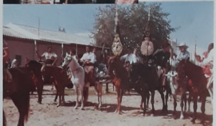
ROMERÍA DE 1976. ACOMPAÑA A TRIANA SOLO CON EL ESTANDARTE.