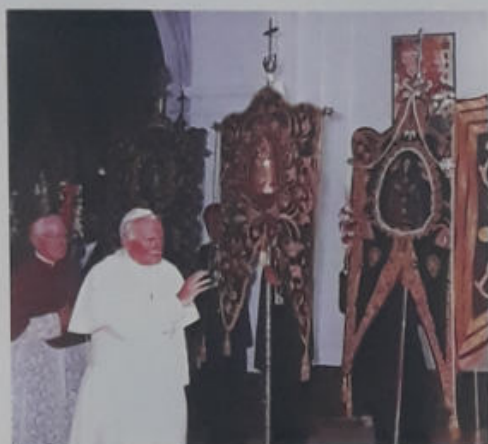
S. S. EL PAPA JUAN PABLO II BENDICE EL SIMPECADO