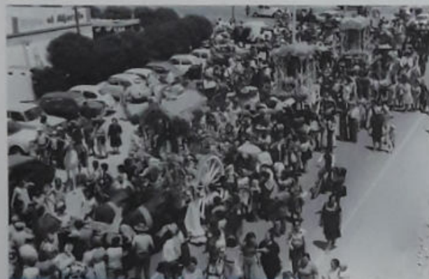
PRIMERA ROMERÍA 1977, AMADRINADA POR TRIANA