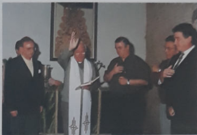
BENDICIÓN DE LA CASA HERMANDAD (1996)