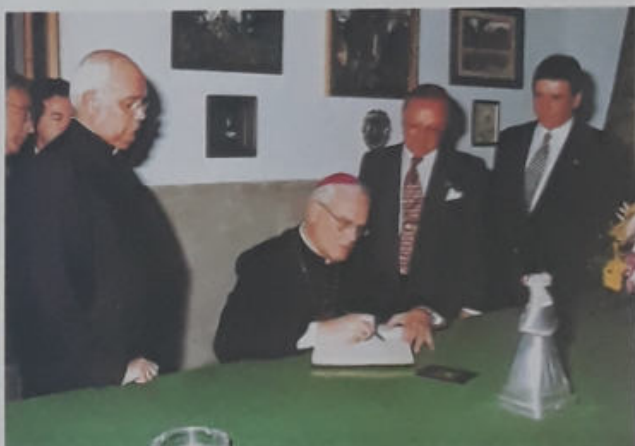
EL ARZOBISPO DE SEVILLA VISITA LA CASA HERMANDAD HNO. MAYOR: MANUEL LÓPEZ FERNÁNDEZ