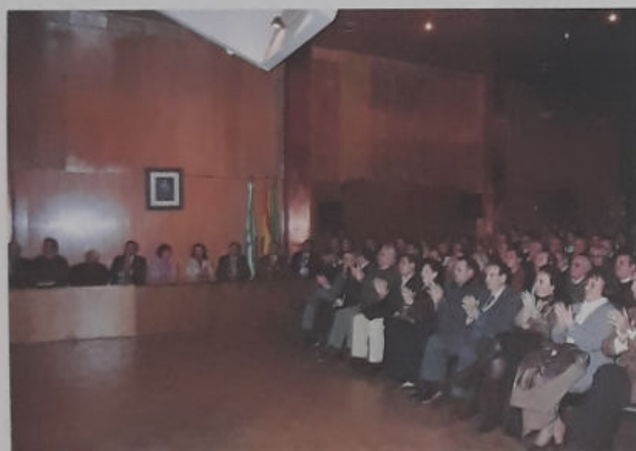
INVITADOS AL ACTO