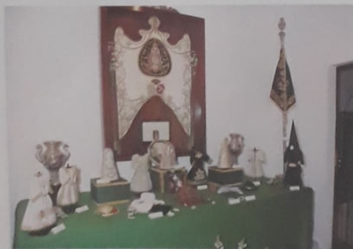
EXPOSICIÓN DE ENSERES