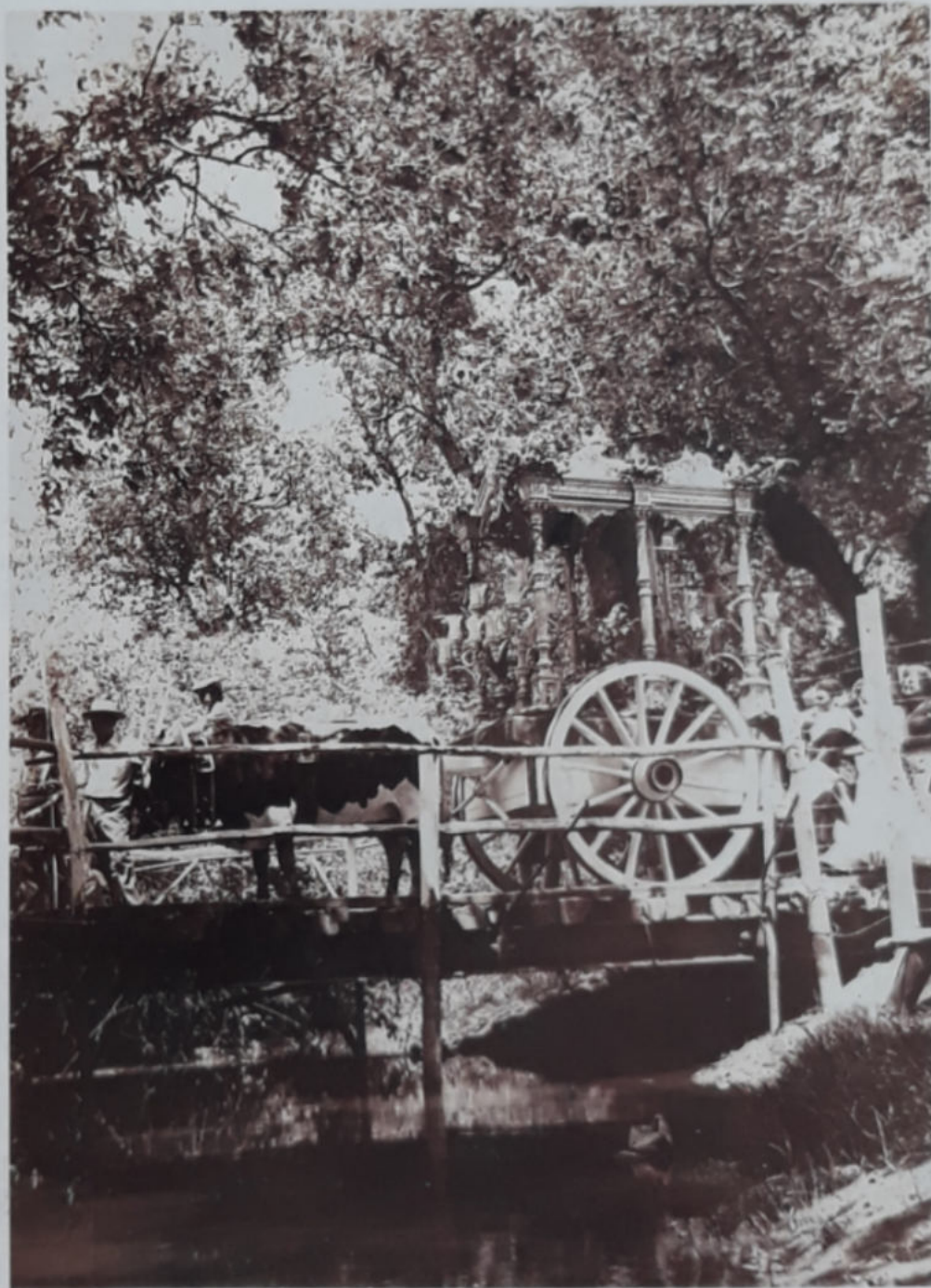
PRIMER PASO DEL PUENTE DEL AJO. AUTOR: JOSÉ M. PALOMAR